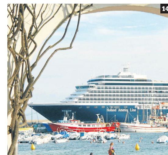
FOTOS: 9. Vista de Llafranc des de la plaça, fa algunes dècades. J. VIDAL. COL·LECCIÓ PACO DALMAU 10. L'arribada del peix al port de Palamós. PACO DALMAU 11. Ambient comercial a Platja d'Aro. AJUNTAMENT DE CASTELL-PLATJA D'ARO 12. Concert a l'església de Sant Genís, del Festival de Música de Torroella de Montgrí. ARXIU PATRONAT DE TURISME 13. Vinyes a l'Empordanet. PACO DALMAU 14. Un creuer a Palamós. PACO DALMAU

(Les imatges que il·lustren aquest reportatge han estat extretes del llibre «La tramuntana justa. El batec de la Costa Brava»)