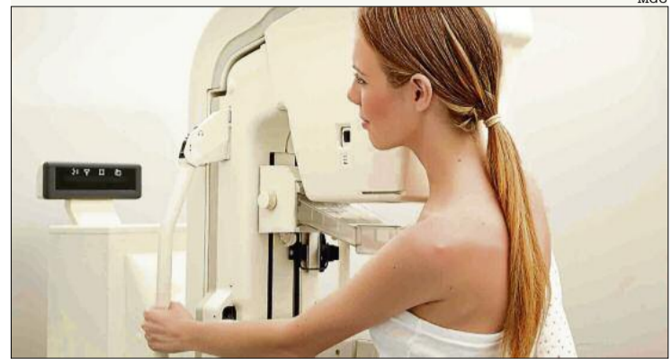
Una de les cobertures és la mamografia en 3D.

La política de la Mútua, pel que fa a cobertures, no ha variat en absolut al llarg dels més de 30 anys d'existència de l'entitat. Aquesta filosofia consisteix, senzillament, a mantenir-les i augmentar-les de manera sistemàtica, incorporant a les assegurances de salut els darrers avenços tecnològics i científics en matèria de detecció, diagnòstic i tractament de les malalties.