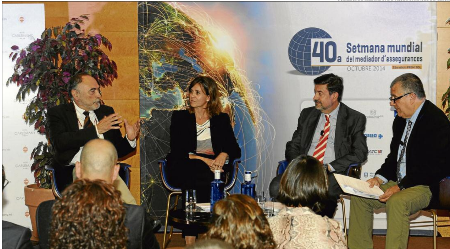
El debat de la programació de l'any passat, 40a Setmana del Mediador d'Assegurances.