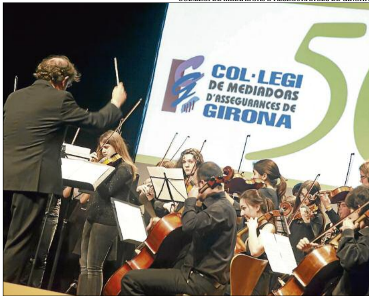
Concert de l'Orquestra del Conservatori de Música del 27 de març.

COL·LEGI DE MEDIADORS D'ASSEGURANCES DE GIRONA