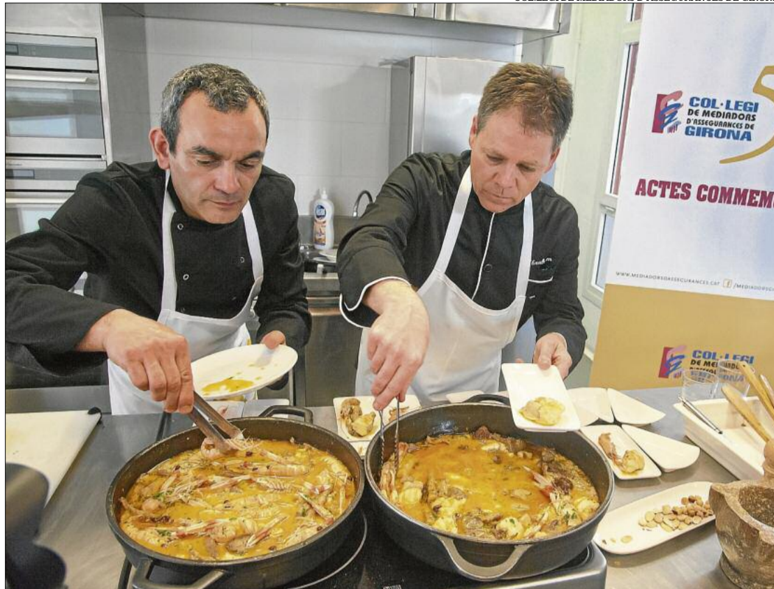
Taller de cuina del 25 d'abril en el qual es va crear el «plat de la mediació».

Pel que fa a aquesta darrera activitat, al llarg de l'any es van presentant diversos enigmes relacionats amb el col·legi i la professió creats per Màrius Serra, que es van publicant a a les xarxes socials, i es premiarà qui n'en-